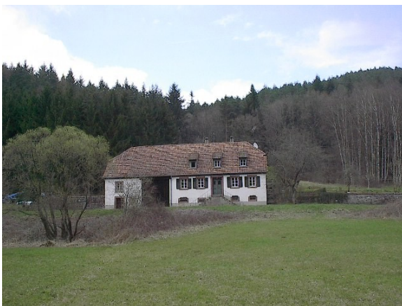
ehemaliges Steigerhaus am Bremmelsberg

Niederschlettenbach liegt in der südlichen Pfalz, in der Verbandsgemeinde Dahner Felsenland, im Südostzipfel des Landkreises Südwestpfalz, Land Rheinland-Pfalz, nur wenige Kilometer von der deutsch-französischen Grenze entfernt. Es liegt an der Einmündung des Erlenbachtals in das Wieslautertal. http://members.futureprojects.info/niederschlettenbach/ort.html