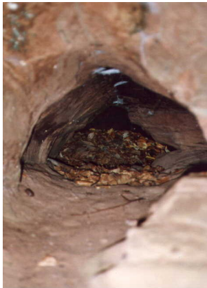
6912/060 Untere Petershöhle