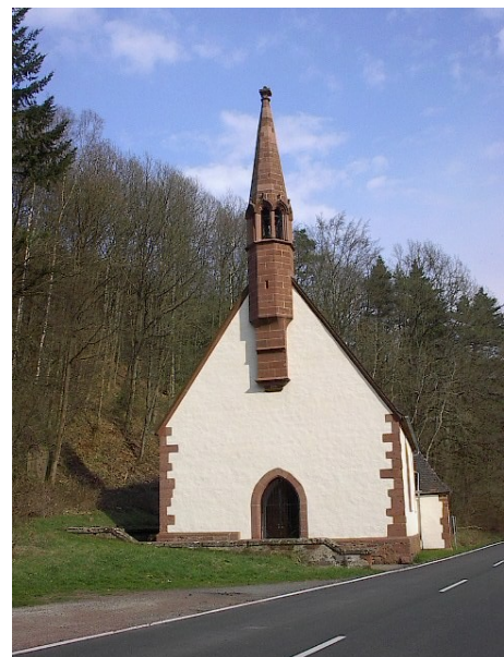
St. Anna Kapelle (16. Jahrh.)

http://www.dahner-felsenland.net/p/d1.asp?artikel_id=1628