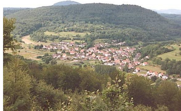
Niederschlettenbach mit Bremmelsberg