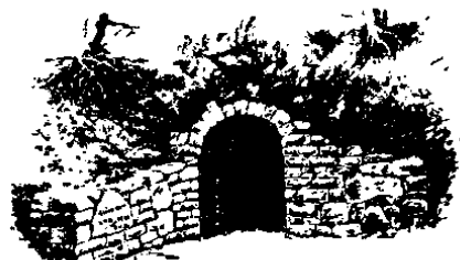
Schaubergwerk Erzgrube Nothweiler