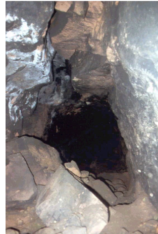
6912/018 Stollen im Kleinen Roßberg